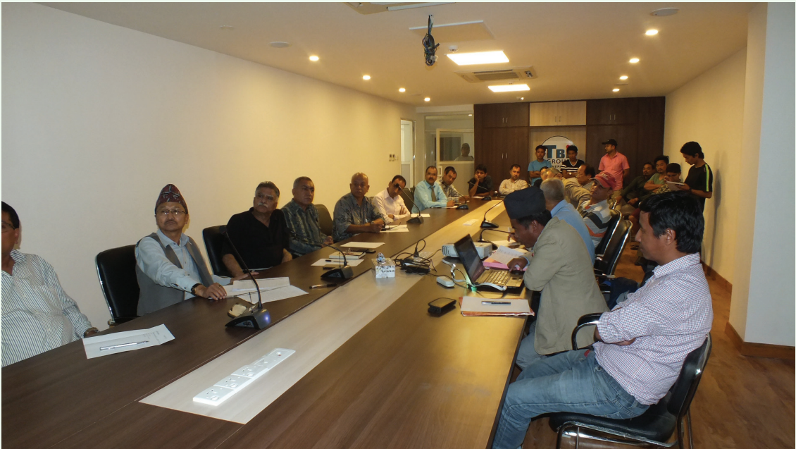
धार्चे गाउँपालिकाको विकासबारे एक बहस कार्यक्रम, काठमाडौँ