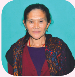
अनार्त गुरुड वडा महिला सदस्य धार्चे गाउँलालिका वडा नं. ५