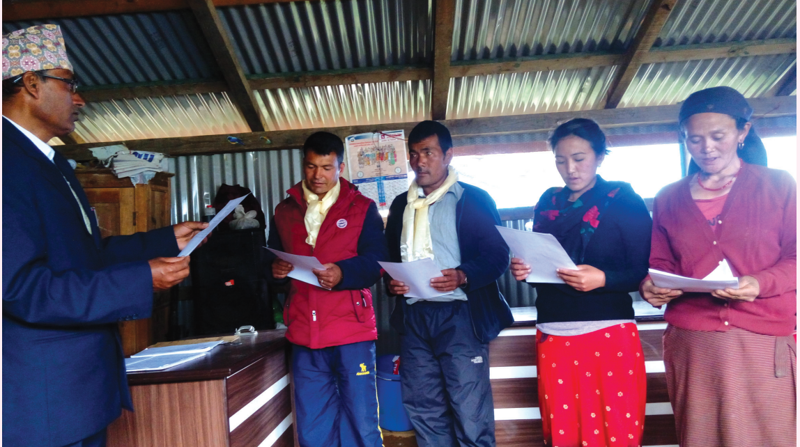
निर्वाचित जनप्रतिनिधिहरूलाई सपथ ग्रहण गराउँदै निर्वाचन अधिकृत