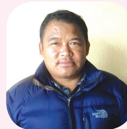
सूर्यमान गुरुड वडा अध्यक्ष धार्चे गाउँलालिका वडा नं. ७