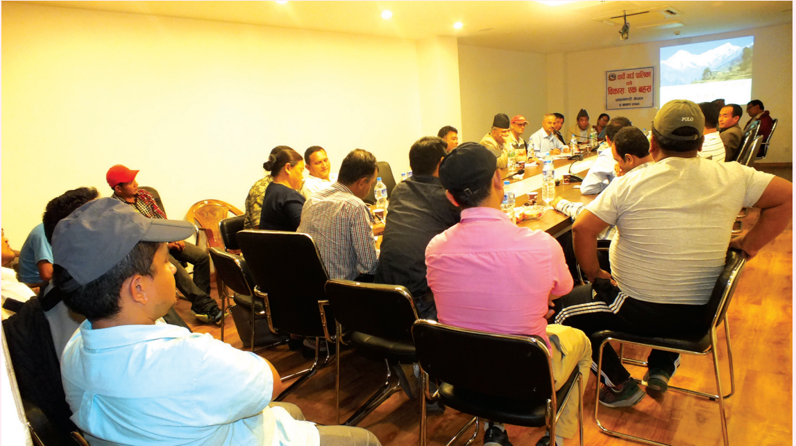
धार्चे गाउँपालिकाको विकासबारे एक बहस कार्यक्रम, काठमाडौँ