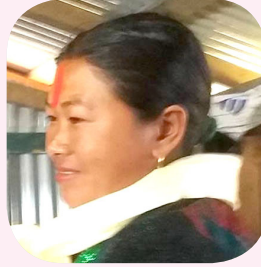
मत्री घले वडा महिला सदस्य धार्चे गाउँलालिका वडा नं. ६