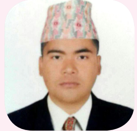
राज गुरुड वडा अध्यक्ष धार्चे गाउँलालिका वडा नं. ४