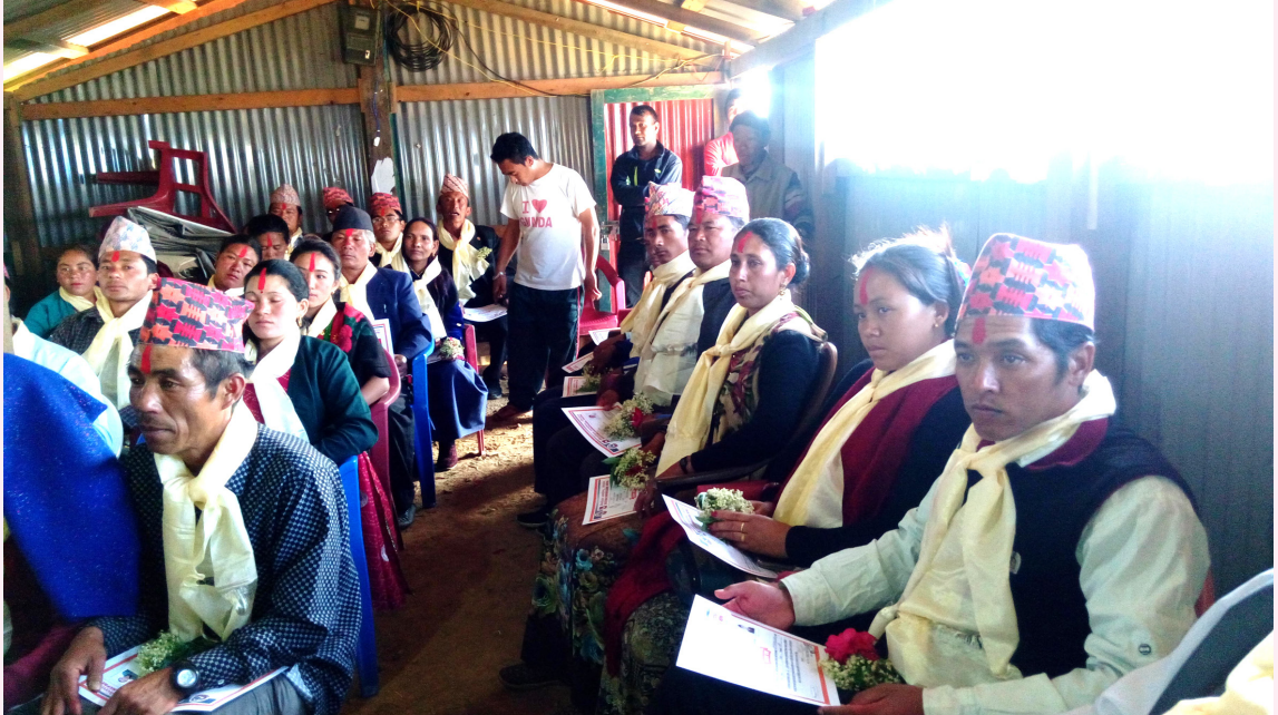
धार्चे गाउँपालिकाको पहिलो बैठक