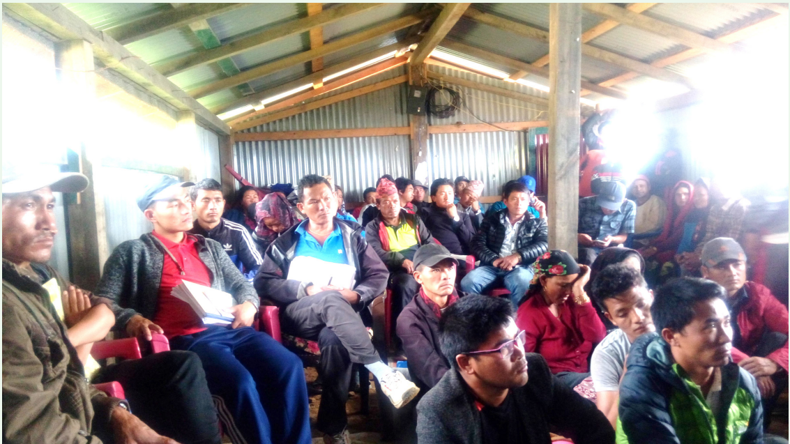
धार्चे गाउँपालिकाको प्रथम गाउँसभामा सहभागीहरू