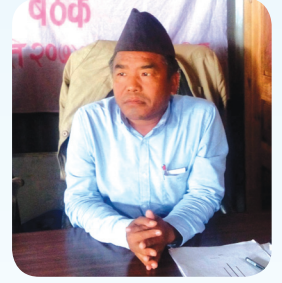
(सन्त बहादुर गुरुड) अध्यक्ष