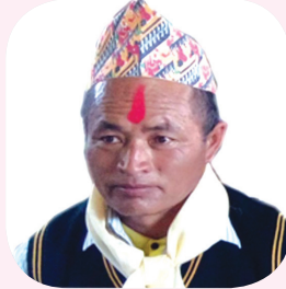
सुक बहादुर गुरुड वडा अध्यक्ष धार्चे गाउँलालिका वडा नं. २