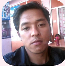
इन्द्रप्रसाद गुरुड वडा अध्यक्ष धार्चे गाउँलालिका वडा नं. ३