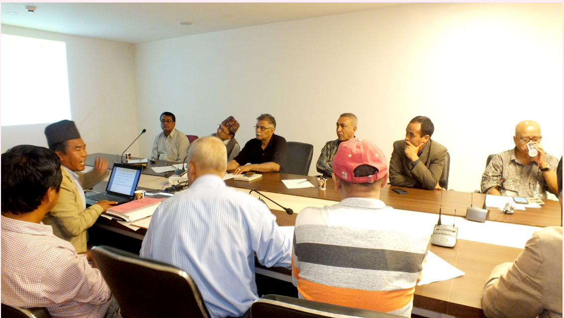
धार्चे गाउँपालिकाको विकासबारे एक बहस कार्यक्रम, काठमाडौँ