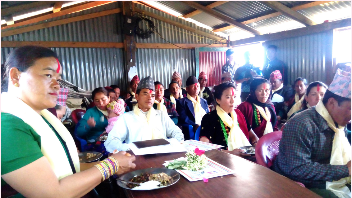
धार्चे गाउँपालिकाको पहिलो बैठक