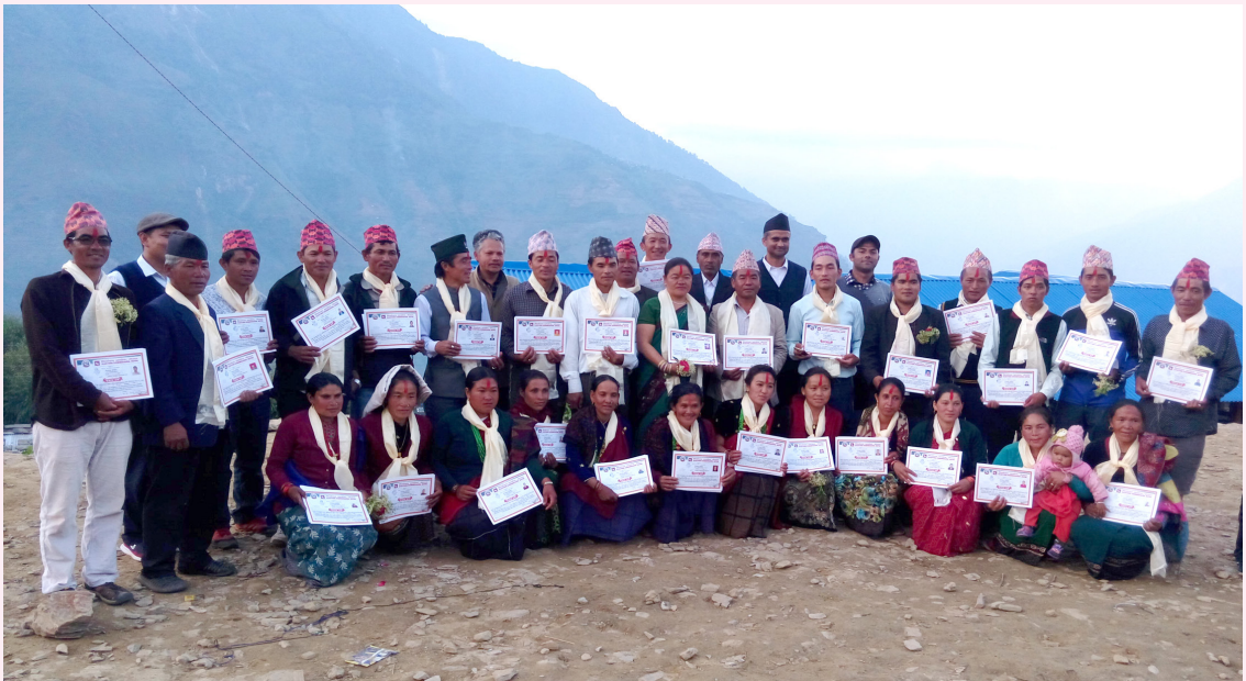
निर्वाचित जनप्रतिनिधिहरूको सामूहिक तस्वीर