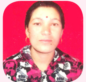
सुकमाया सुनार वडा द.म.स. धार्चे गाउँलालिका वडा नं. ४