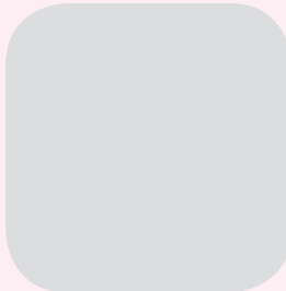
कान्छी वि.क. वडा द.म.स. धार्चे गाउँलालिका वडा नं. २