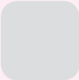
कमला वि.क. वडा द.म.स. धार्चे गाउँलालिका वडा नं. १