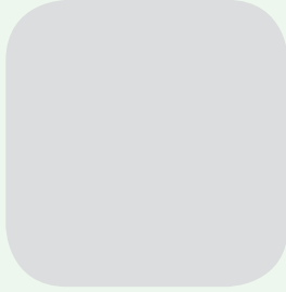
सन्त बहादुर गुरुड