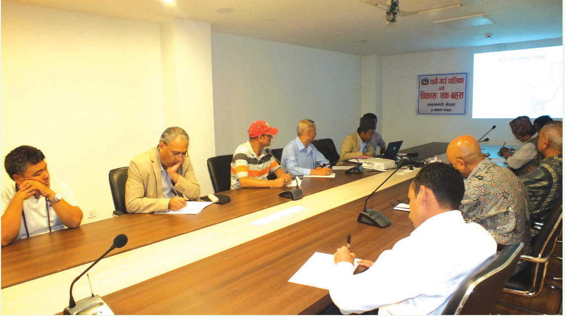
धार्चे गाउँपालिकाको विकासबारे एक बहस कार्यक्रम, काठमाडौँ