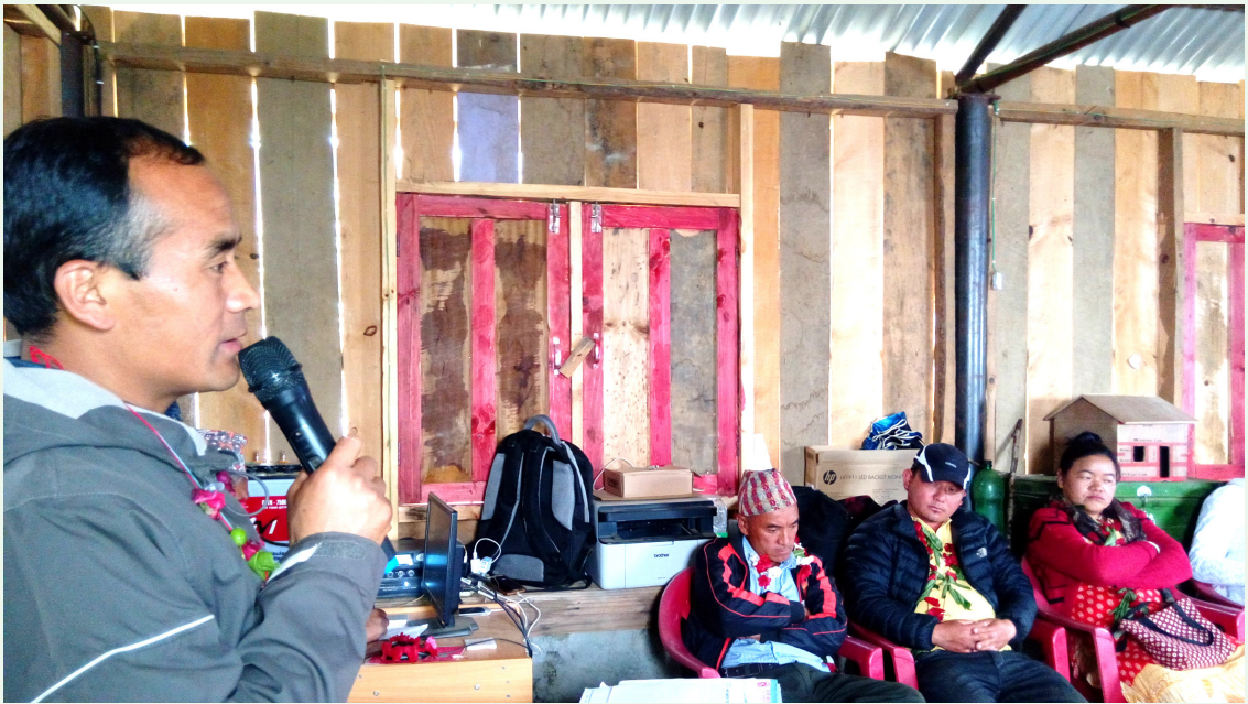
धार्चे गाउँपालिकाका निर्वाचित जनप्रतिनिधिहरूलाई बधाइ दिँदै- माननीय क. छमबहादुर गुरुङ